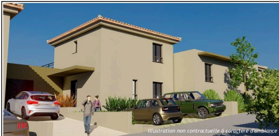
Illustration non contractuelle à caractère d'ambiance