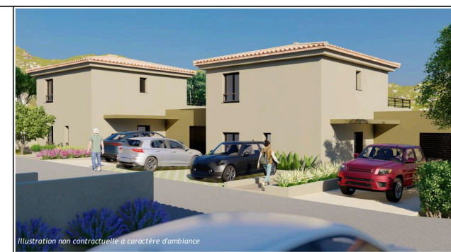
Illustration non contractuelle à caractère d'ambiance